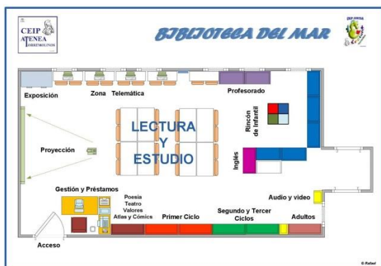
Plano de la BE "Biblioteca del Mar"

Además, la biblioteca del centro se está convirtiendo en un instrumento de apoyo para los planes y programas que se articulan en nuestro centro educativo.