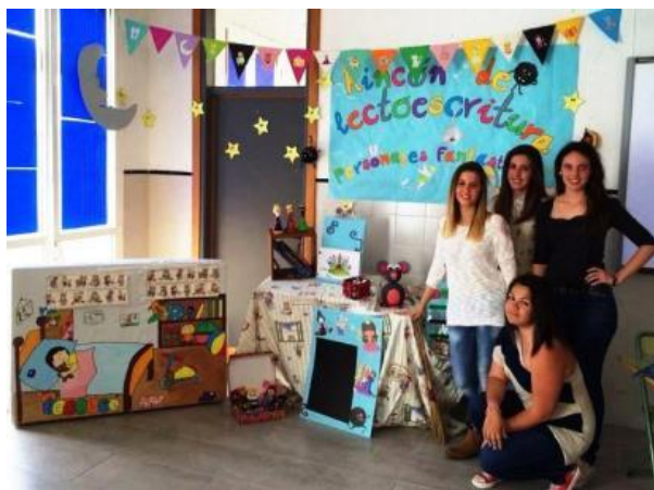
Alumnado de 1º de Didáctica de Educación Infantil