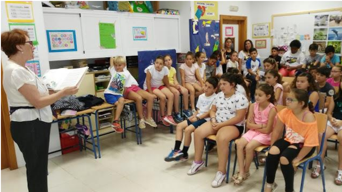
Una abuela nos presenta a Platero