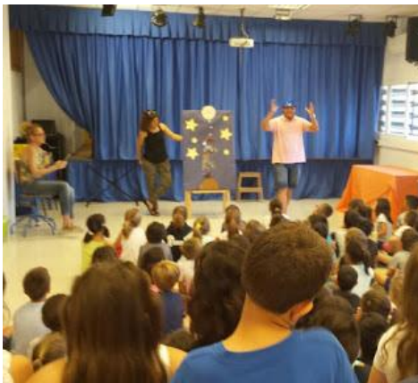
Cuentacuentos: ¿A qué sabe la luna?